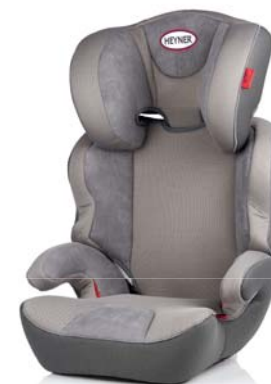
MaxiProtect ERGO SP