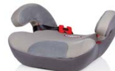
SafeUp L ERGO