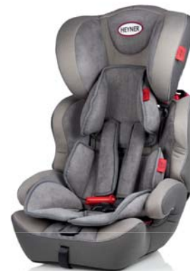
MultiProtect ERGO SP