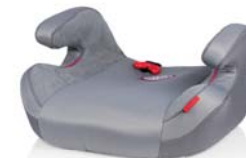
SafeUp XL Comfort

In unterschiedlichen Farben erhältlich. In different colors available. Имеется в продаже разного цвета.